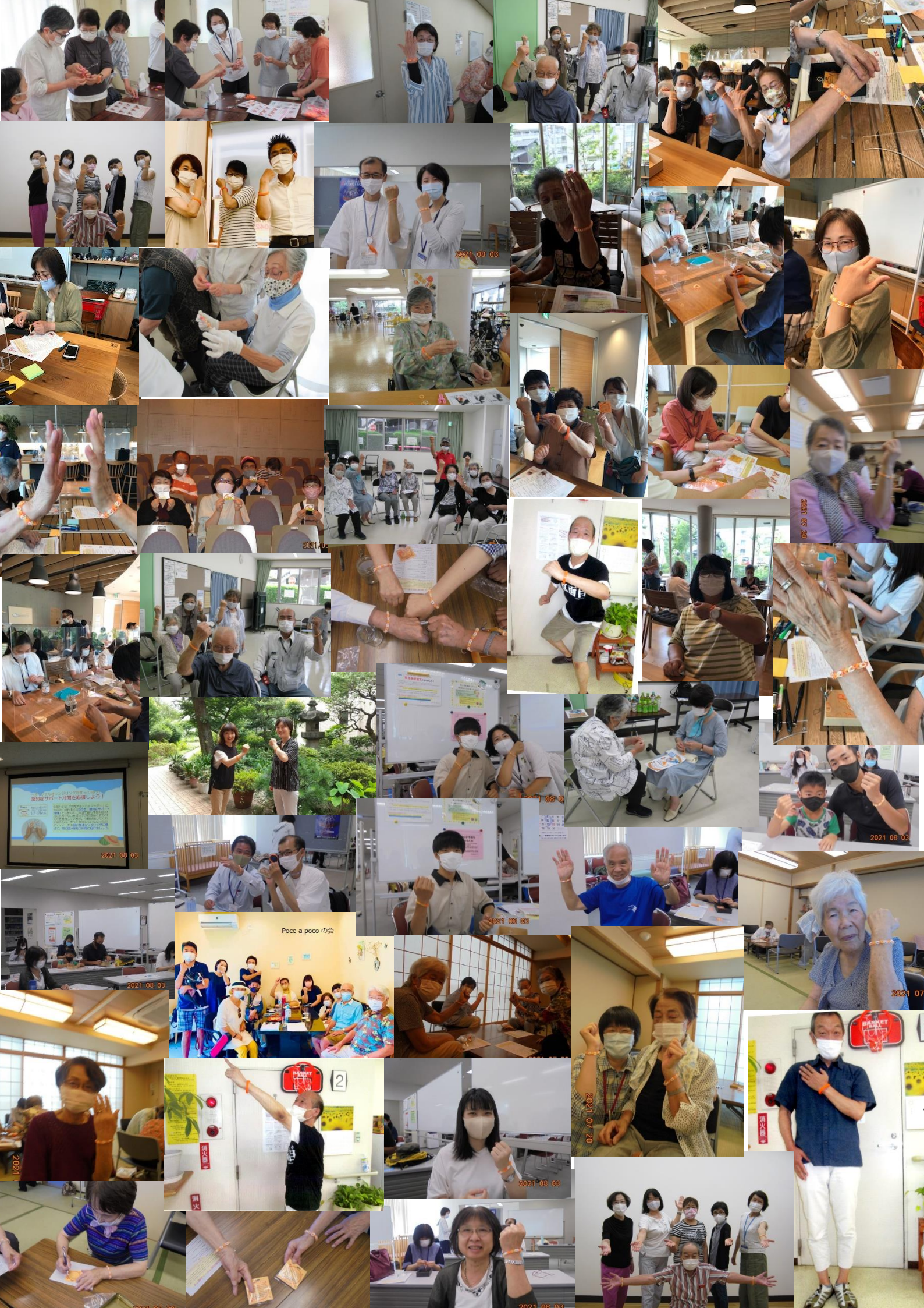
Poco a poco の会