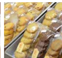
クッキーはごま、チョコチップ、くるみ&アーモンド、紅茶、ココア、抹茶、コーヒー、季節のクッキーの8種類があります

ティールーム・クッキングハウス 東京都調布市布田1-26-7 山富ビル102・103 ☎042-484-4103 (定休日:土日祝日)