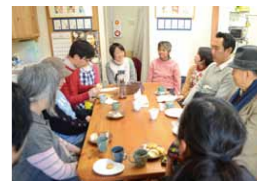
13時半～15時頃の交流タイム。この日は一般の方、精神科医の先生もいらっやいました

ここは、心の病や悩みを持つ方の居場所、社会参加のスキルを練習する場、さらには地域の方々との交流の場として開設されたティールームです。毎日13時半～15時頃は、交流タイムとなっていて、一般の方もコーヒーや紅茶を飲みながら交流することができます。会話の内容は日によってさまざま。ゆったりとした会話を楽しむことで「利用者も一般の人も、ともに元気になれます」とスタッフの弁。ここでは10時～17時まで、利用者が作ったフロランタンやビスコッティ、シフォンケーキなどの焼き菓子の販売もしていて、「おいしい!」と評判を集めています。