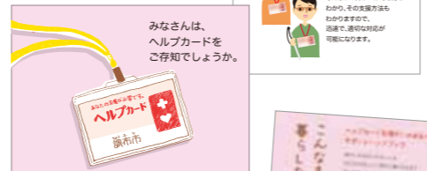
DVDの貸し出しも行っていきます。イベントなどでぜひ上映ください