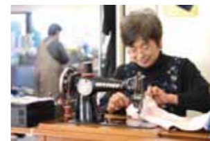
和服のリメイクも手がけます