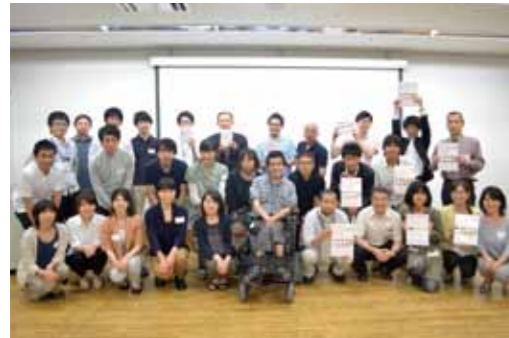
■調布ヘルプカード普及プロジェクト http://helpcard.chofu.com 調布市障害福祉課 ☎042-481-7094

「ヘルプカード」のことをベースに「調布での豊かな暮らし」を語り合う「調布未来語りフォーラム」5回開催