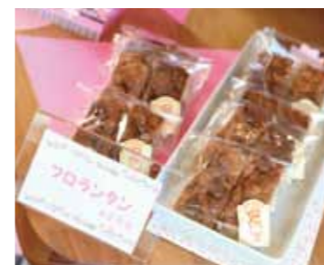
人気のフロランタン。店では、メンタルヘルス関連の本やCDなども販売しています