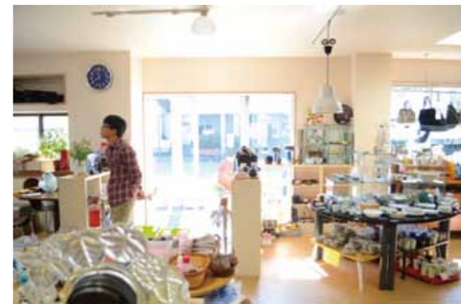
バラエティ豊かな雑貨が並び店内