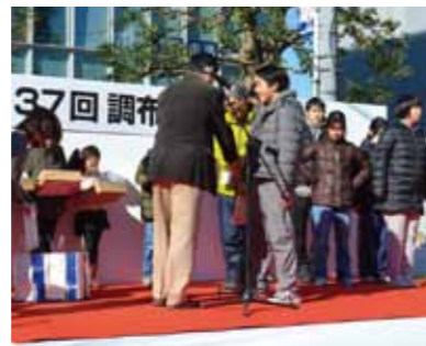
12月6日「福祉まつり」会場で市長より表彰がありました