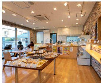
総菜パンからスイーツまで種類豊富。メロンパン130円など手ごろな価格もうれしい。

ベーカリー&カフェ「ほっとれ〜る」は、調布市社会福祉事業団の就労移行支援事業所「すまいる分室」と障害者相談支援事業所「ちようふだぞう」の共同運営の施設です。「すまいる」のパンのほか、市内の作業所の選りすぐりの品を展示販売しています。営業時間 11時～17時（日曜休み・祝日はパンの販売はありません）