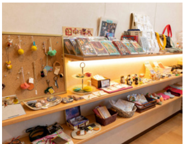
市内の作業所作品やお菓子、障害者アーティストによる雑貨やアクセサリーも販売。