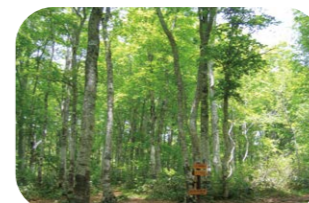
カヤの平高原「ブナの森」

木島平村は、長野県の北端に位置し、日本一美しいといわれるブナの原生林が広がるカヤの平高原や、そこから流れ出す豊かな水などの大自然に恵まれています。寒暖の差が激しい気候は、農作物の栽培に適しており、とりわけ特Aコシヒカリの「木島平米」は市場で高く評価されています。