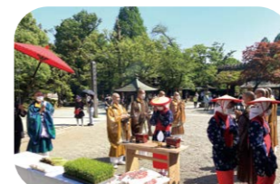
深大寺「お田植えの儀」

木島平村は、長野県の北端に位置し、日本一美しいといわれるブナの原生林が広がるカヤの平高原や、そこから流れ出す豊かな水などの大自然に恵まれています。寒暖の差が激しい気候は、農作物の栽培に適しており、とりわけ特Aコシヒカリの「木島平米」は市場で高く評価されています。