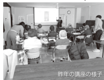
昨年の講座の様子