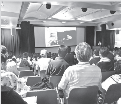
▲桐朋学園ポロニアホールで行われた「南極教室」観覧のようす

【参加者の声】 ●久々に学ぶ、知るよろこびを感じた。マイナス70度の地にも生物がいて、植物のナンキョクユメスキ、ナンキョクミドリナデシコなどはえていることに驚きました。(70代) ●地球温暖化で南極の氷が溶け、オゾンホールが大きくなっていると情報を聞くが、実情はどこまで深刻かを知れたかった。(50代) ●本日の通信衛星の体験をはじめ、知りたい南極を学ぶこと。氷の音を聞いたり、さわったりと貴重な体験をさせて頂きました。(80代) ●若い学生と時間を共有して良かった。(70代) ●世界の平和の陸地、あのように住環境が整えられるまでの御苦労、それぞれに研究者の熱意、深く思いました。(80代)