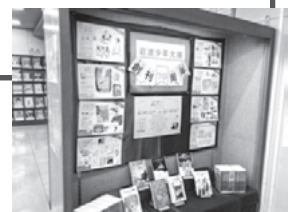
入り口の特別展示は、職員の知恵と工夫で作られています。