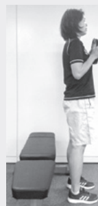
足で床をしっかり押して立ち上がる。

▶思っていたストレッチよりも難しかったが、呼吸のしかたなど、初めて気づくこともあり、今後の生活に取り入れていこうと思っています。