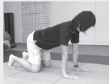
手は肩の真下、股関節の真下に膝、足首は曲げる。