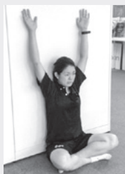
あぐらをかきお尻と背中を壁につける。