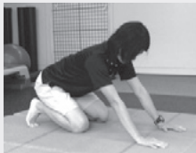
背中とは真つす一枚板。お尻側にゆっくり引く。