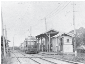
京王電気軌道開通当時の調布駅