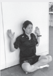
肘と手を壁に遣わせ肩甲骨を使って上げ下げする。