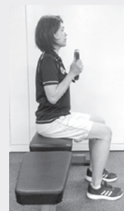
両足を床にしっかりつける。