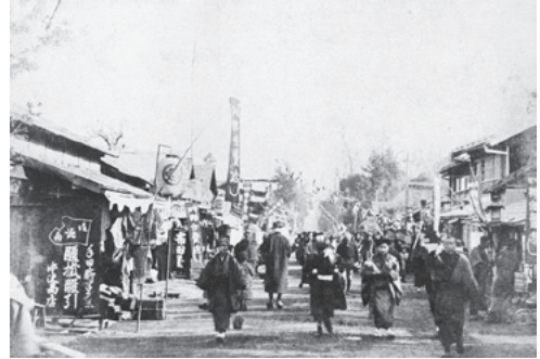
明治時代末期の甲州街道