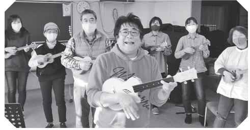
※撮影のため、講師は一時的にマスクを外しています。

癒しの音色、ウクレレの弾き方など基本的な話を聞き、ウクレレサークル「ノアエリア」の練習を見学してみませんか。楽器をお持ちの方は一緒に音を出してみましよう。