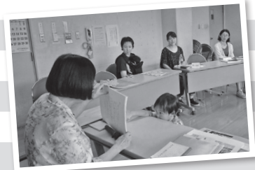
写真：山崎さんのお話