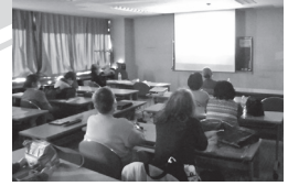
調布ドキュメンタリー映画くらぶの活動の様子