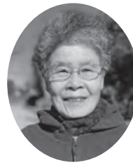
有機農産物普及・堆肥化推進協会事務局長

生ごみを焼却せず、堆肥にして土に還す活動を推進し、豊かな土壌と健康によい農作物や花づくりを普及。循環型社会実現をめざしている。