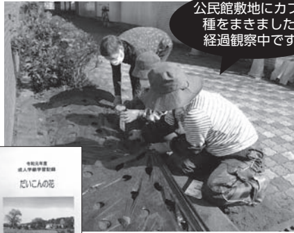
公民館敷地にカブの種をまきました。経過観察中です。