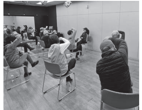
▲北部公民館での健康教室の様子