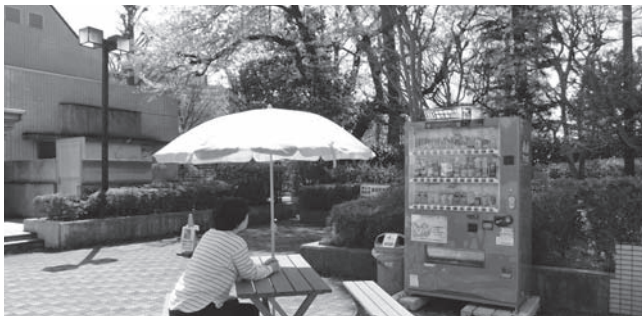
自販機コーナーは屋外になりました。正門を入れて右側にあります。館内コピー機は、館内1階奥(階段下)にあります。ご利用ください。