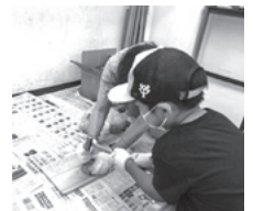
▲化石探し(花粉や木の葉、枝が見つかりました)

●夏休みの自由研究にしようと思って参加した。先生が持ってきた大きな化石を実際に触ることができてよかった。写真もたくさん撮れたので自宅でも自由研究としてまとめたい。(4年生)