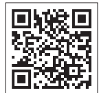
昨年の文化祭の様子がYouTube動画で見られます。

申し込み不要。直接会場にお越しください。定員は当日先着になります。 やむを得ない事情により、発表や催しの中止及び公演日時の変更がある場合があります。 事前に北部公民館へお問合せください。