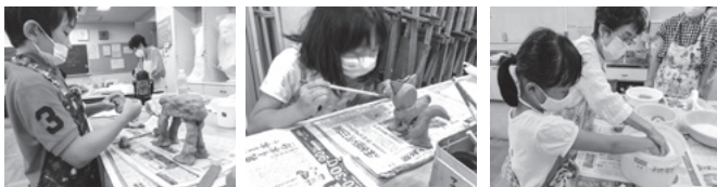
▲粘土で形づくり ▲色付け ▲釉薬(ゆうやく)がけ

夏休みの人気教室のひとつである同教室。今年は8人の子どもたちが作品作りに挑戦しました。自分でスケッチした動物の絵を見ながら、粘土をこねて形作り、色付け、釉薬*がけ、陶芸窯に入れて焼く、といった一連の工程を体験しました。最後は展示室で自分の作品を並べ、工夫して飾りつけをしました。時間をかけたものづくりを通して、その大変さ、面白さ、難しさ、達成感を感じつつ、教室を無事終えることができました。