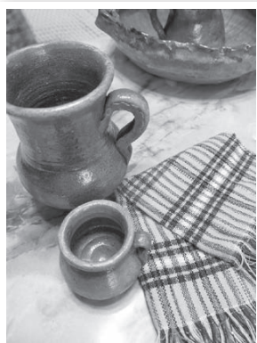
▲普段の生活で使用している陶器