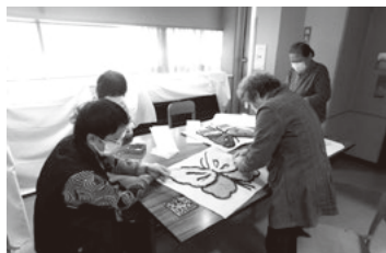
▲紙遊びの会 (展示準備)