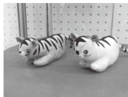
▲つるし飾り「和」作品