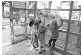
▲城山保育園の展示準備