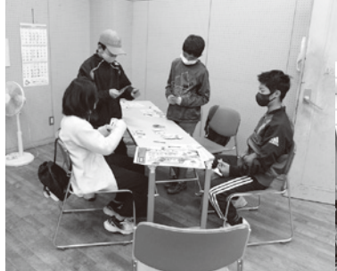
↑カードゲームの様子

地元深大寺通り商店会プロデュースのカードゲーム「十王坂の審理」(初披露)と「調布いろはかるた」「調布かるた」で遊びました。子どもが集まるのはいい風景です。(公民館)