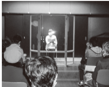
↓トルヴェール朗読公演