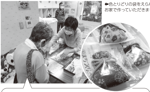
←色とりどりの袋をえらんで、お家で作っていただきました。