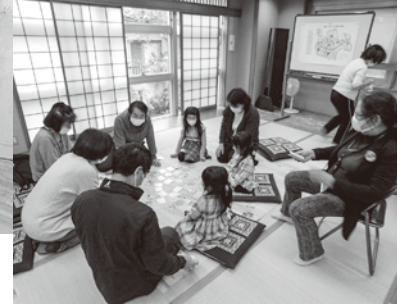
↓かるたとり熱戦中です!