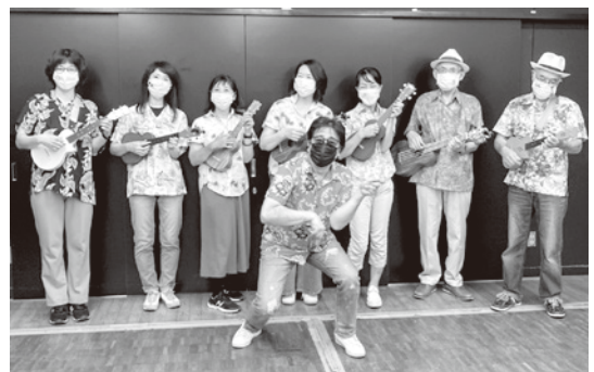
↑アロハ・アウィナラ(映像作品の一場面)