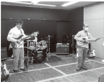
↑ダブルベースのバンド演奏