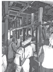
◀三鷹市大沢の里にある水車小屋にて