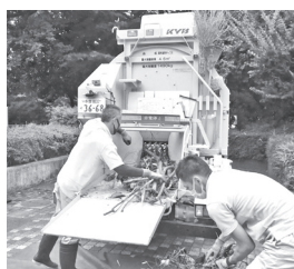
▲剪定した枝を破碎するところ