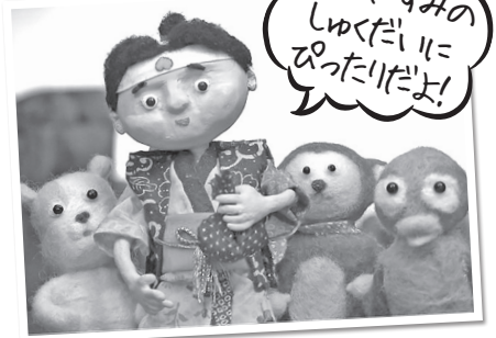
「鬼退治したくない桃太郎」より