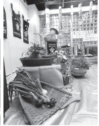
昨年5月に行った農のいけ花展の様子です