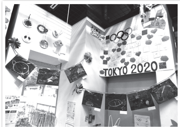
▲昨年の展示の様子