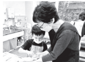
▲釉薬(ゆうやく)がけ&拭き取り