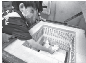
▲本焼き前の窯づめ