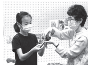
▲最後に崎玉先生から講評をいただく