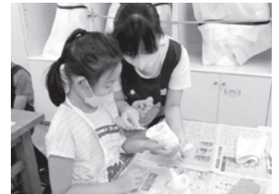
▲中学生になった子ども陶芸教室OGが製作のサポートをしました。

自分でスケッチした動物の絵を見ながら、粘土をこねて形作り、色付け、釉薬がけ、陶芸窯に入れて焼く、といった一連の工程を体験しました。昨年の陶芸教室参加者(現在中学1年女子)が子どもたちのサポートをしてくれるという嬉しいサプライズも。時間をかけたものづくりを通して、面白さ、難しさ、達成感を味わえたかと思ひます。さまざまな表情の動物たちがギャラリーに並び、子ども達の絵画作品もいっしょに、元気いっぱい展覧会をすることができました。