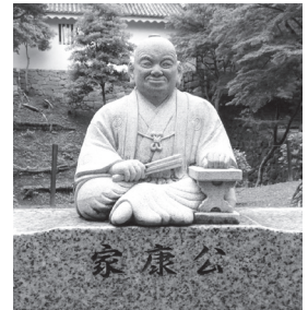
岡崎城にある、竹千代像と家康公像