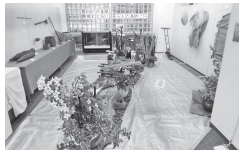
▲こちらは昨年の展示の様子。「野川とともに暮らしたあの頃」というテーマで展示しました。

季節の農作物や花などを、農具や民具に活かしてみせる展示です。今回は、公民館近隣農家の盆行事で作る盆棚を再現します。野菜や果物など飾って祖先を祀る夏の祈りの風景をご紹介します。