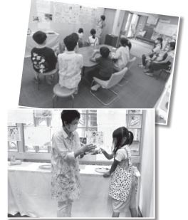
▲最後に埼玉先生から講評をいただく