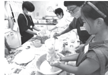
▲釉薬(ゆうやく)がけ