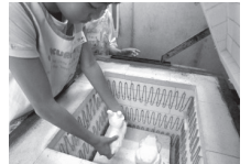
▲本焼き前の窯づめ