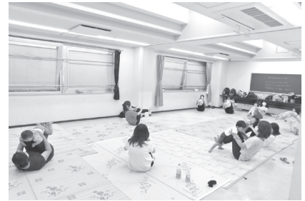
▲昨年の教室の様子