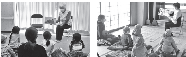
▲実際に保育園の子どもたちを前に「よみきかせ会」を開催した場面では、受講者のみなさんが数名のグループになり、それぞれが練習の成果を発表しました。

数カ月間かけて学んできた読み聞かせ講座でしたが、今後はそれぞれの受講者が自分のフィールド（家庭内、職場、ボランティア等：保育園、小学校、福祉施設、高齢者施設、学童クラブ、公民館等）で、活躍していきます！