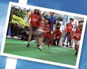
ラグマルくん ラグビー応援アンバサダー@調布