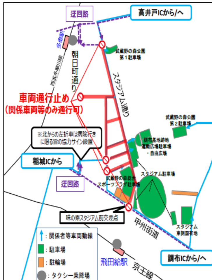
【スタジアム通り周辺の規制範囲】

※平成31年3月22日東京都オリンピック・パラリンピック及びラグビーワールドカップ推進対策特別委員会資料より抜粋