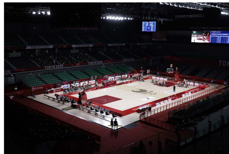
武蔵野の森総合スポーツプラザ Musashino Forest Sport Plaza