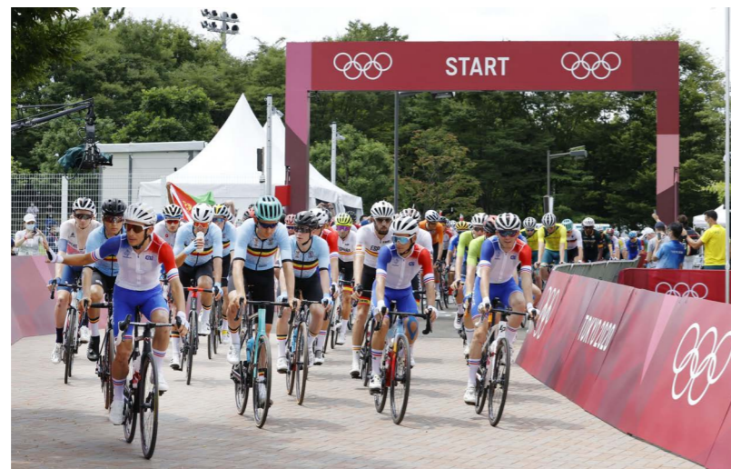
武蔵野の森公園 Musashinonomori Park

The area encompassing the venues and their surroundings was named "Musashino Forest Olympic and Paralympic Park" to commemorate the Tokyo 2020 Games and convey the excitement and memories of the Games to future generations.