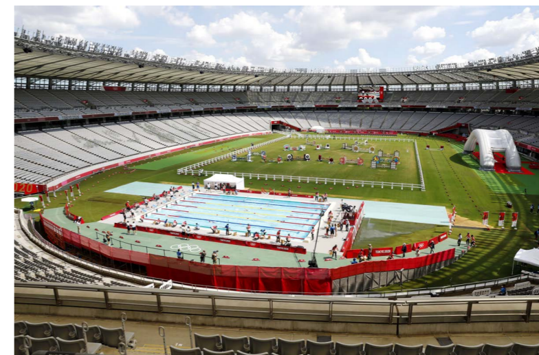
東京スタジアム Tokyo Stadium