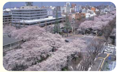
市役所前通りの紙並木(神奈川県相模原市)