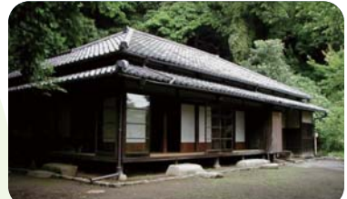
旧川喜多邸別邸(神奈川県鎌倉市)