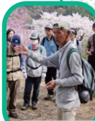
桜守が桜の楽しみ方をガイドします

美しい多摩づくりの象徴として、多摩川流域にある桜の名所の中から特に八十八ヵ所を選定、願いごとをたずさえて巡る巡礼のように、多摩川流域にある「桜の名所・八十八ヵ所」を、願いごとをたずさえて訪れ、桜を鑑賞する楽しみ方を提案しています。