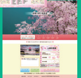
ホームページ・トップ画面