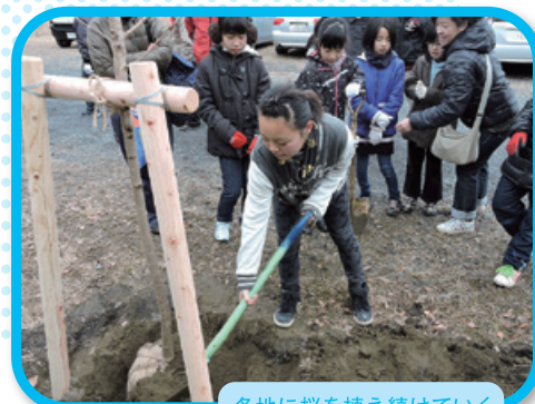
各地に桜を植え続けていく