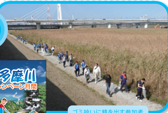
ゴミ拾いに精を出す参加者