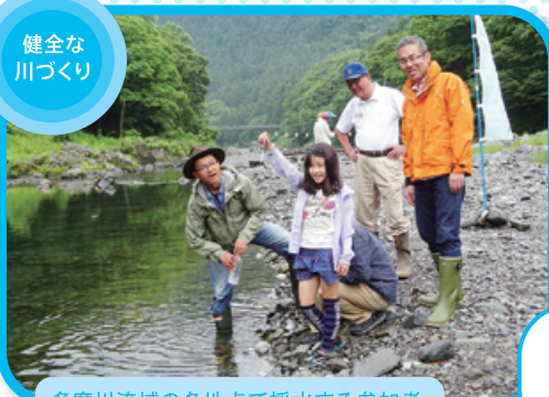
多摩川流域の各地点で採水する参加者