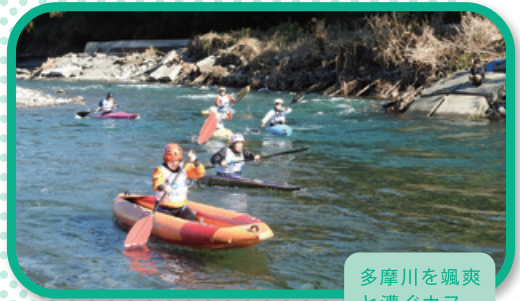
多摩川を颯爽と漕ぐカヌー駅伝走者