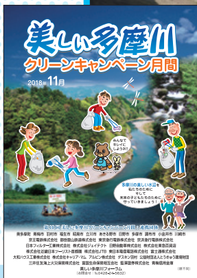
クリーンキャンペーン月間のポスター

いつまでも多摩川水系の美しい水辺を維持していこうと、多摩川流域の自治体、企業、市民が連携したゴミ清掃活動「美しい多摩川クリーンキャンペーン」を毎年11月に実施しています。