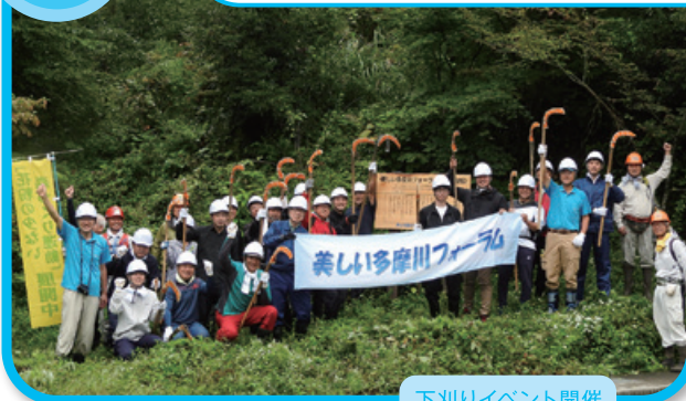
下刈りイベント開催

「美しい多摩川フォーラムの森(青梅)」にて、広葉樹の植樹や下刈りイベントを行うなど、水源地の森の環境整備に努めています。