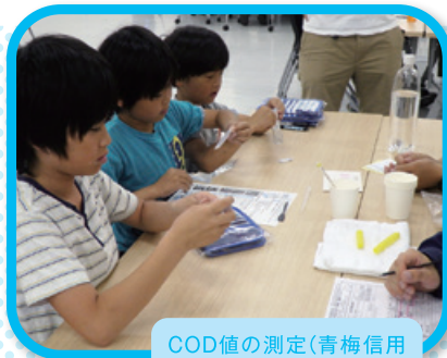
COD値の測定(青梅信用金庫本店の調査会場)