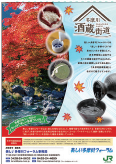
多摩川酒蔵街道のチラシ