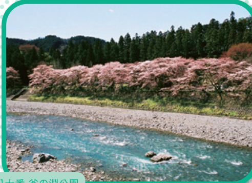
八十番 釜の淵公園