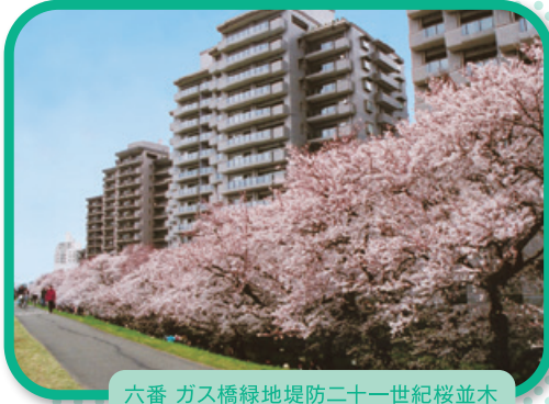
六番 ガス橋緑地堤防二十一世紀桜並木