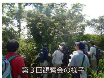
第3回観察会の様子

講師から植物の見分け方についての解説を受けながら観察を行いました。当日は植物52種を観察することができました。