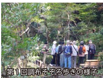
第1回調布そぞろ歩きの様子