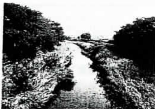
台風一過の野川(細田橋より下流 8/25(土)) 草がなぎ倒され、ゴミがたくさん引っかかっているが、久しぶりに川らしい野川をみた。

去年の1月中旬に紀州に犬を買いに行った際、紀勢本線に乗ることができました。これまで、労働組合の会議で色々な場所に行きましたが、こちらの方面は伊勢までしか行ったことがなく、期待して列車に乗り込みましたが、やはり照葉樹林地帯のまっただなかであるだけに、関東地方で見かける風景とは違いました。紀州に近づくと電線に集団でとまっている鳥が目につきました。それは無数のトビでした。東京ではカラスが集団でとまっているのが普通であり、奇異な感じがしました。やはり、生態系の違い、環境の相違があるのでしょうか。東京でカラスが増えたのは、人間の環境への係りかたに問題があるのは事実ですが、紀州ではどうなのでしょう。