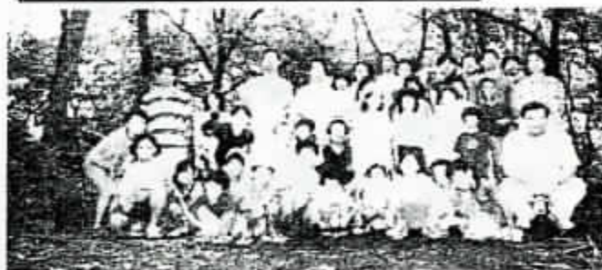
サマーキャンプ 参加者全員で記念撮影

内容：①パートナーシップで行われている環境保全活動の紹介 ②ワークショップ ③提言づくりに向けて ④ディスカッション