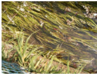
佐須用水に生育するミクリ 昨年より増えたようだ

今年度の環境モニターは、市民の方に調布の自然環境をご案内する年 2 回の「調布そぞろ歩き」と、市内水辺の植物観察を年 8 回行います。