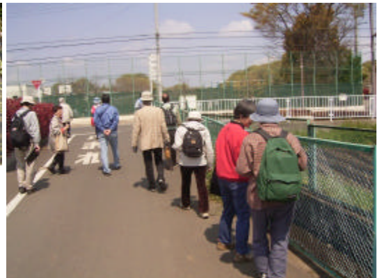
4/8 佐須用水に沿って柏野小周辺の田んぼへ向かう環境モニターのメンバー

4 月 8 日(日)には新メンバーも参加し、佐須用水周辺と田んぼの植物を観察して歩きました。田んぼの数は本当になくなってしまいましたが、コオニタビラコやレンゲの咲いている風景はとても気持ちの良いものでした。(報告: 鍛冶)