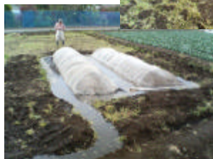
十分に水が 廻った苗床