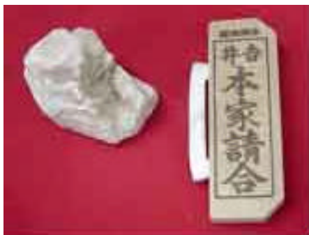
江戸時代から伝わる 火打ち鎌と多摩川の チャート

85%の人が1と思っているというデータがありますが、正解は3です。鉄より固い石で鉄を欠いて火花が出るという仕組みです。火花は火口(ほくち)で採ります。実際に起こすのは熟練がいります。火花だけならすぐ、誰でもできるようになります。