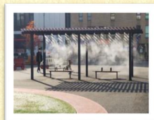
パーゴラとミストの設置