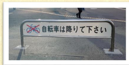
中央口前の車止め

調布市 都市整備部 街づくり事業課 〒182-8511 東京都調布市小島町2-35-1 TEL:042-481-7417 FAX:042-481-6800 E-mail: seibi@w2.city.chofu.tokyo.jp