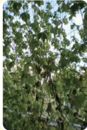
▲市庁舎での壁面緑化の様子