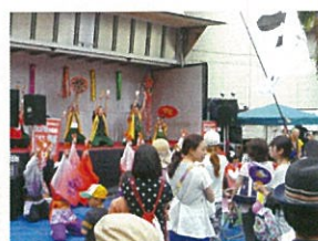
トレーラーを使ったイベントや七夕飾りの様子