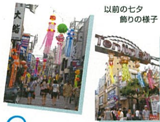
以前の七夕飾りの様子

このページは調布市内での消費を願い、調布市商工会「バイ調布推進事業」の一環として展開しています。そしてこのまちに根付いている、商店会をもっと知ってもらおうと企画しました。