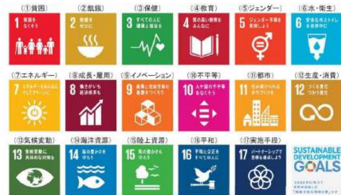
ロゴ：国連広報センター作成

※SDGs（エスディーゼーズ）とは、平成27（2015）年9月の国連サミットにおいて、日本を含む193か国の合意により採択された国際的な目標のことです。先進国・開発途上国を問わず、公共・民間各層のあらゆる関係者が連携しながら、世界全体の経済・社会・環境をめぐる広範な課題に統合的に取り組むための持続可能な開発のゴールとして17の目標が掲げられています。