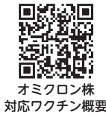
オミクロン株 対応ワクチン概要