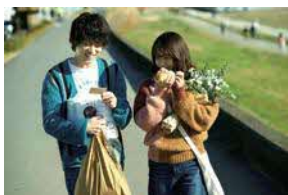
「花束みたいな恋をした」

これまでに調布市で撮影された映画・映像作品の紹介、俳優のサインやポスターなどを展示します。また、映画「花束みたいな恋をした」(主演:菅田将暉、有村架純)の衣装展示も行います。 期 2月11日(祝)～19日(日) 時 午前10時～午後7時 所 文化会館たづくり2階北ギャラリー