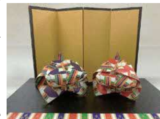
折り紙のおひなさま