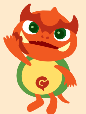
「映画のまち調布」 応援キャラクター ガチャラ ©角川大映スタジオ

「映画のまち調布 シネマフェスティバル2024」の上映作品と各賞のノミネート作品を決定します。 期 9月3日(日)まで 対 市内在住・在勤・在学の方、イオンシネマシアタス調布の来場者 対象作品/令和4年9月1日～令和5年8月31日(日)に国内の商業映画劇場で、有料で初公開された日本映画 投票方法/インターネット投票、投票箱設置会場(市役所、文化会館たづくり、グリーンホールほか)で投票用紙による投票 他 詳細はHP「映画のまち調布シネマフェスティバル」参照 問 (公財)調布市文化・コミュニティ振興財団 ☎441-6150 (文化生涯学習課)