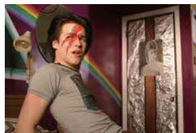
「C.R.A.Z.Y.」 ©2005 PRODUCTIONS ZAC INC.