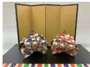
折り紙のおひなさま