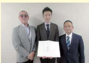
左から八田危機管理担当部長 (有)ファン三浦専務取締役 狛江市・岡危機管理監