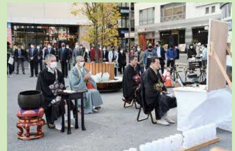
東日本大震災慰霊祭2022の様子