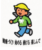
健康な歩行を促す