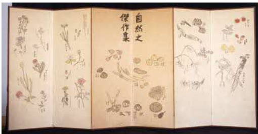
武者小路実篤「自然之傑作集」1941年頃 六曲屏風