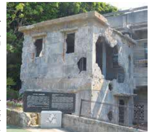
伊江島公益質屋跡