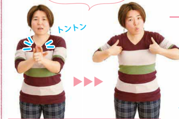
左手をグー、右手をパーにして、トントンと合わせてから、両手で両肩をトントンと叩く。