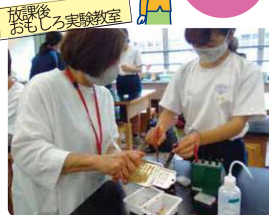
放課後おもしろ実験教室