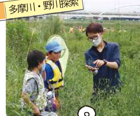
多摩川・野川探索