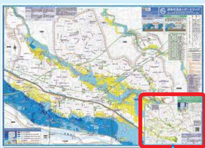
内水浸水 想定区域図

近年、雨の降り方が局地化、頻発化、激甚化し、全国的に下水道施設の整備水準を上回る量の降雨が発生していることから、最大規模の降雨をもとに内水による浸水の想定範囲や浸水する深さを色分けした区域図を作成しました。 ※内水による浸水…下水道の雨水排水能力を超える降雨などにより、マンホールなどから水があふれること