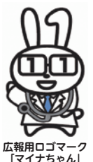
広報用ロゴマーク「マイナちゃん」