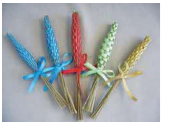
ラベンダースティック

期・回 ①5月31日(休)・講演「地産地消とサステナブルのすすめ」②6月10日(出)・ぬか漬け作り③24日(出)・ラベンダースティック作り④7月5日(休)・講演「自然によりそう農の暮らし、年中行事など」