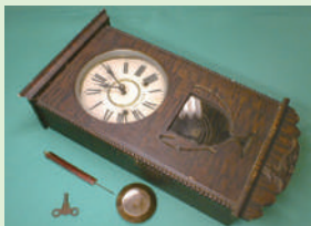
長崎市稲佐町で収集した柱時計