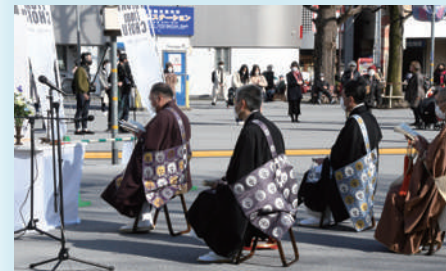
東日本大震災 慰霊祭2021の様子

図 東日本大震災慰霊祭実行委員会・養老 ☎080-6354-2960 (福祉総務課)