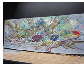
ペイントアート「トナカイ」