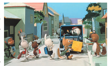
どうぶつむらの子どもたち