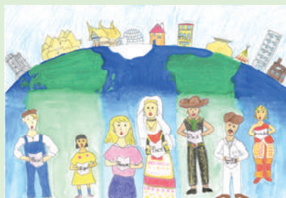
調布っ子“平和なまち”絵画コンテスト2021 6～10歳の部市長賞 石橋恵さん (10)