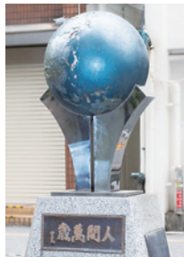
三鷹市中央通り「地球を支える手」

5月21日(出)午前10時から6月5日(日)午後5時までに電話で申し込み(申し込み順。定員になり次第締切)