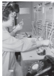
市役所の電話交換手(昭和40年ごろ)