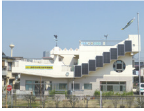
多摩川自然情報館外観

〒03-3406-1724 (平日午前10時～午後5時30分)、 多摩川自然情報館携帯電話080-2087-9009 (土・日曜日、祝日午前9時～午後5時) (環境政策課)