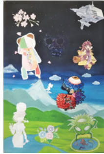
鹿島学園高校の高校生の合同作品

甲6月15日(出)までに直接または電話・Eメール(☎seibuk@w2.city.chofu.tokyo.jp)で申し込み(Eメールの場合は電話番号を明記)※抽選結果は16日(出)以降に連絡