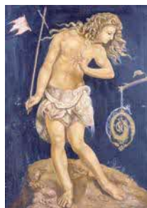
河野通勢「聖ヨハネ」1918年頃