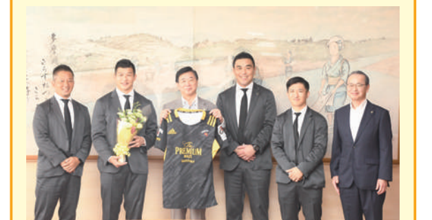
申 スポーツ振興課 ☎481-7496

ジャパンラグビー リーグワン2022シーズンで 準優勝という素晴らしい結果を残した東京サント リーサンゴリアスの皆さんが、7月6日に市長を 訪問し、今シーズンの戦いぶりや来シーズンに向 けた意気込みについて語っていただきました。市 長からはさまざまな事業への協力に対する感謝と、 市全体で引き続き応援することなどを伝えました。 市では東京サントリーサンゴリアスのホストエリ アの一つとして、連携企画や情報発信などを今後 も実施していきます。