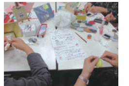
みんなでつくります

日 生涯学習情報コーナー ☎441-6155(たづくり休 館日を除く平日午前9時～正午、午後1時～午後5時) (文化生涯学習課)