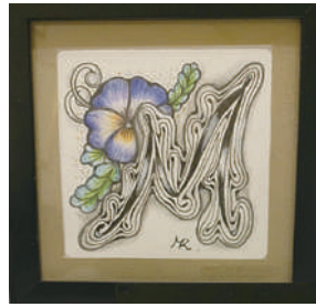
アルファベットと植物

ゼンタングルとは、禅とタングル(絡む)という言葉をつなげた造語です。簡単なパターンをくり返し描くため、お子さんでも楽しめます。