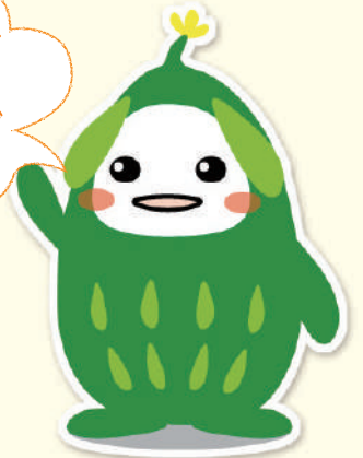
▲調布市地球温暖化対策啓発キャラクター ゴヤたん