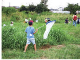
茂みの中も探します

日 7月27日(水)から電話で運営 受託者(株)セルコ ☎03-3406- 1724(平日の午前10時～午後 5時30分) (環境政策課)