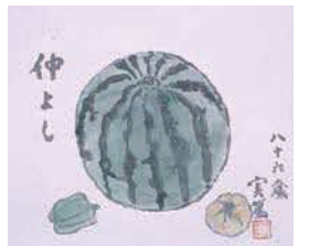
武者小路実篤「西瓜」1971年