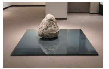
《関係項》 1968/2019年 石、鉄、ガラス 石:約80×60×80cm 鉄:240×200×1.6cm ガラス:240×200×1.5cm 森美術館、東京