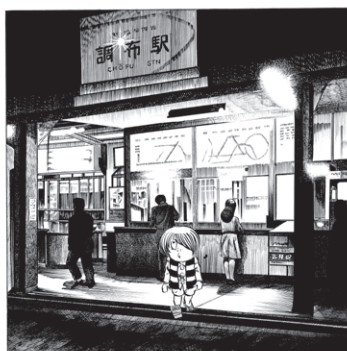
図書館だより挿絵