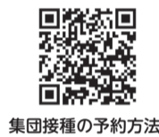
集団接種の予約方法