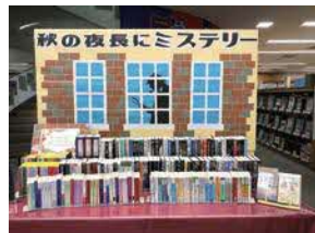
「秋の夜長にミステリー」おすすめ図書