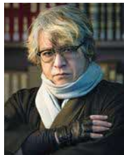
京極夏彦